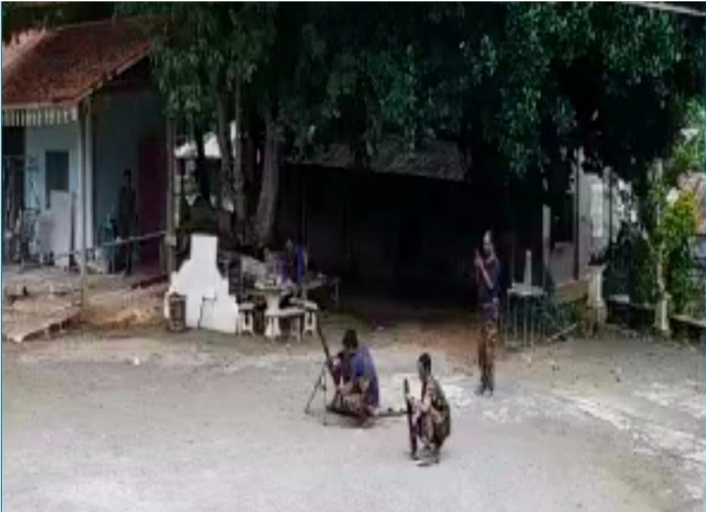
ကွန်ကောက်ဘုန်းကြီးကျောင်းရှိစစ်ကောင်စီတပ်သားများ

အောက်တိုဘာလ (၁၀)ရက်၊ မွန်းလွဲ ၁:၃၀ နာရီမှ ၂နာရီအတွင်း စစ်ကောင်စီတပ်သည် ကွန်ကောက်ကျေးရွာ ဘုန်းကြီးကျောင်းတွင် တပ်စွဲ၍ ပတ်ပတ်လည်ရှိ KIA တပ်သားများရှိရာတောင်ကုန်းများသို့ လက်နက်ကြီးများဖြင့် ပစ်ခတ်ခဲ့သည်။