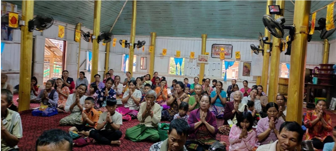
ဟိုမိန်းဘုန်းကြီးကျောင်းတွင်တိမ်းရှောင်နေသောစစ်ရှောင်များ

ဤအချက်များအပြင် အခြားကျေးရွာမှ ရာချီသောဒေသခံများသည် အခြားဒေသများသို့ စစ်ဘေးရှောင်ထွက်ပြေးခဲ့ကြသည်။ ပန်နား ရွာသားများသည် စယ်အူ ဘုန်းကြီးကျောင်းသို့လည်းကောင်း၊ ကုန်းညောင်ရွာသားများသည် လားရှိုးမြို့၊ ကွမ်းလုံမြို့၊ ဟိုပန်မြို့ရှိ ၎င်းတို့၏အမျိုးများထံသို့လည်းကောင်း၊ ကောင်းချိုရွာသားများနှင့် ဖိုင်ခမ်းရွာသားတို့သည် ဖိုင်ခမ်း ဘုန်းကြီးကျောင်းသို့လည်းကောင်း အသီးသီးထွက်ပြေး တိမ်းရှောင်ခဲ့ကြရသည်။