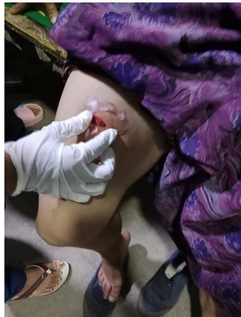
စစ်ကောင်စီ၏လက်နက်ကြီးကြောင့်ဒဏ်ရာရသောအမျိုးသမီး

စက်တင်ဘာလ ၁၇ ရက်တွင် မူဆယ်မြို့နယ် တောင်ဘက်စွန်း ဝိန်းနန်းကျေးရွာတောင်ဘက်တွင် စစ်ကောင်စီတပ်နှင့် TNLA တို့တိုက်ပွဲများစတင်ဖြစ်ပွားခဲ့သည်။