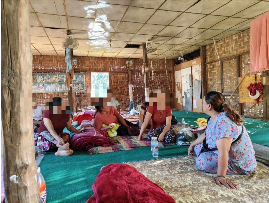
ဘုန်းကြီးကျောင်း၌တိမ်းရှောင်နေကျသောစစ်ရှောင်များ

ဆုံးပတ်တွင် တိုက်ပွဲများကြောင့်ထွက်ပြေးတိမ်းရှောင်ခဲ့ရသူများဖြစ်ပြီး တိုက်ပွဲများငြိမ်သက် သွားသည့်စက်တင်ဘာလ ပထမပတ်တွင်မှ နေအိမ်သို့ပြန်လာသူများဖြစ်သည်။