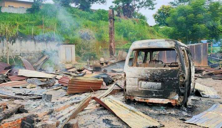
စယ်လန်ကျေးရွာတွင်ပျက်စီးသွားသောဒေသခံများ၏နေအိမ်

သက် ၃၀ ဝန်းကျင်အရွယ် အမျိုးသားတစ်ဦးနှင့် အသက် ၅၀ အမျိုးသားတစ်ဦးတို့ လည်ပင်းနှင့်ပေါင်တွင်တို့တွင် အသီးသီးဒဏ်ရာရရှိခဲ့သည်။