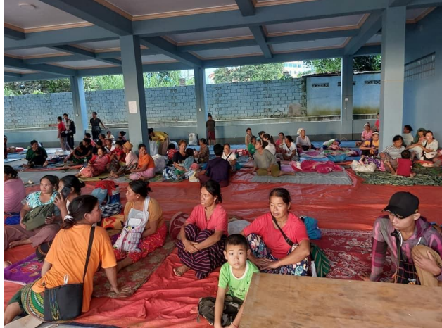
လက်နက်ကြီးများနှင့်တိုက်ပွဲများမှထွက်ပြေးတိမ်းရှောင်သောဒေသခံများ

တိုက်ပွဲများကြောင့် စယ်လန်ကျေးရွာအုပ်စု ဖိုင်မောင်ရွာ နှင့် ဖိုင်ကျောင်းရွာ၊ နမ့်ကတ်ကျေးရွာအုပ်စု မန်ကန်ရွာ၊ နမ့်ကတ်ရွာ၊ နမ့်ဟုတ်ရွာများမှ ဒေသခံပြည်သူ ၂၀၀၀ ခန့်သည် မူဆယ်မြို့ စွမ်စော်ရပ်ကွက်၊ ဟိုနားရပ်ကွပ် ခန်းမ နှင့် နမ့်ခမ်းမြို့ တုန်ခွမ်ရွာ ဘုန်းကြီးကျောင်းတို့တွင် ထွက်ပြေးတိမ်းရှောင်နေရသည်။