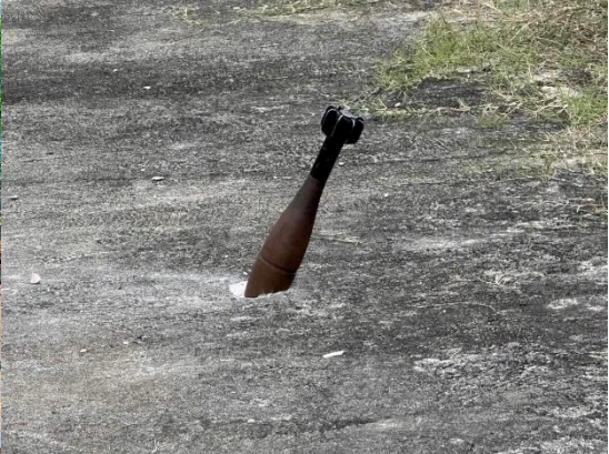
စယ်လန်ကျေးရွာတွင်းမပေါက်ကွဲသေးသောဗုံး

ဩဂုတ်လ ၂၉ ရက်နေ့ညပိုင်းတွင် စယ်လန်ကျေးရွာ အတွင်း သို့ TNLA တပ်သားများ ဝင်ရောက်လာခဲ့ပြီးနောက် စစ်ကောင် တပ်မှ ကျေးရွာအတွင်းသို့လက်နက်ကြီးများဖြင့် ဆက်တိုက်ပစ်ခတ်ခဲ့ရာ ညနေပိုင်းတွင် စယ်လန်ကျေးရွာ မူကြိုကျောင်းအတွင်းသို့ လက်နက်ကြီးကျရောက်ခဲ့ပြီး မီးလောင်ခဲ့သည်။ ည ၈နာရီဝန်းကျင်တွင် စစ်ကောင်စီ၏ လက်နက်ကြီးသည် စယ်လန်ကျေးရွာအုပ်စု ဖိုင်ကျောင်းရွာအတွင်းသို့ ကျရောက်ခဲ့ပြီး နေအိမ် ၂လုံး၊ ကားတစ်စီး၊ လယ်ထွန်စက်တစ်စီး လုံးဝမီးလောင်ပြာကျခဲ့ပြီးနေအိမ် ၄လုံးထိခိုက်ပျက်စီးခဲ့သည်။