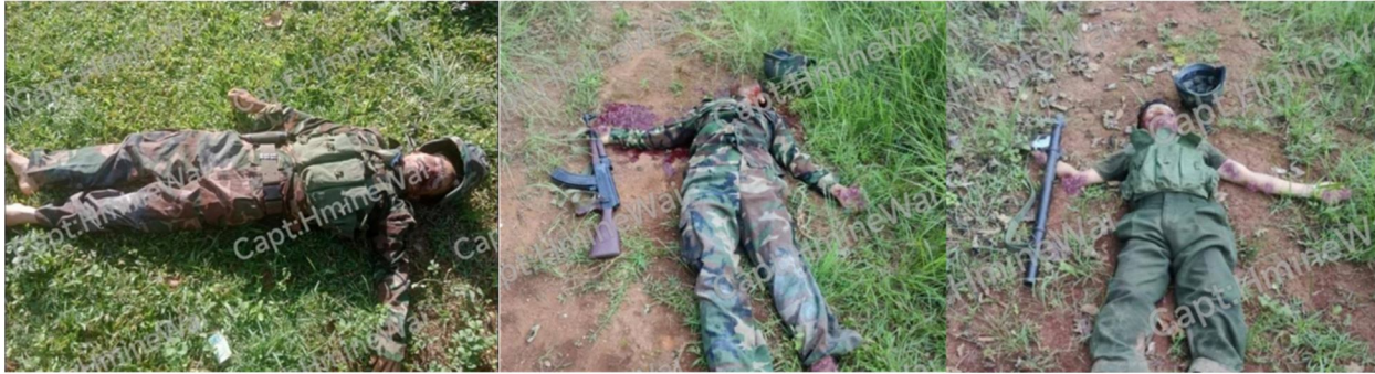
ခပ်းတူဝ်တံ၊ ကူးကံးလား၊ တူးလျ, ငလး, ပရိုခ်းကွင်, ကခ်သိုဂ်းမခ်းတံ,သေကပ်ခိုခ်းခိုင်ကွခ်းလံး

ဂမ်) တိမတ်.ကပ်ဂျာတီးတပ်.ခပ် ကခ်မီးခိုင်လွဲဂိုမ်းဝါခ်းခမ်.ကုမ်။ လုမ်းပျီ,တုလိတ်.ကခ်မီးဂျး ခခ်း, ရှခ်သိုဂ်းမခ်းပေ.ထုပ်.ဂူခ်းခခ်း,သွင်ဂေ.ခခ်း.သေ ယိုဝ်းတံ။