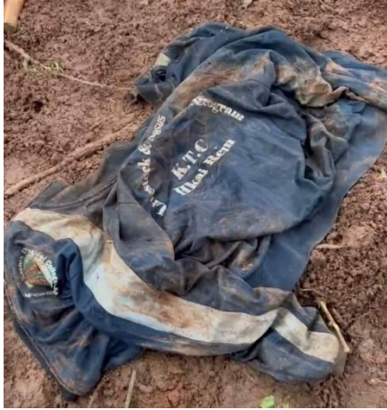
သိုဝ်းဂပ်,ဂပ်,ကပ်ဂွမ်းခေခေ,ခပ်ဂေ.ခိုင်;ခင်း

မိုဝ်းဝမ်းထိ 29/7/2023 ခေခေ.သိုဝ်းမာခမ်း; ဗလယ 123 တပ်.ခေမ်. ဗန်းဂျာ ယိုဝ်းဂွင်းလှိုင်ခပ်ခပ်;ဂျှုခင်း ဝါခမ်းလွဲဂွင်းဂျှုဂျှု; တင်း တင်း;တေ,ဂင်ဝမ်းထိုင်ဝါးဝမ်း။ မိုဝ်းခမ်းယမ်း 9:45 ဂင်ခမ်းခေခေ. မာန်, လှိုင်ဂျှု,တိုဝ်.လျှုးရှိုခမ်းခင်းဝါခမ်းလွဲဂွင်း လင် ခိုင်; သေ တိုဝ်.လျှုးခေခေ.ယိုဝ်းဂေ.ခိုင်; တေ,ကေး ကံ, ကျယု 60 တံ။ ငလ; ခေခေ.ယိုဝ်း တေ,ကေးဝမ်း ကျယု 40 မာတ်,လိပ်း ငလ;ကွမ်း,ယိုဝ်း လွဲ,ပု.ပု.ဝိခမ်း ကျယု 15 ပီ။