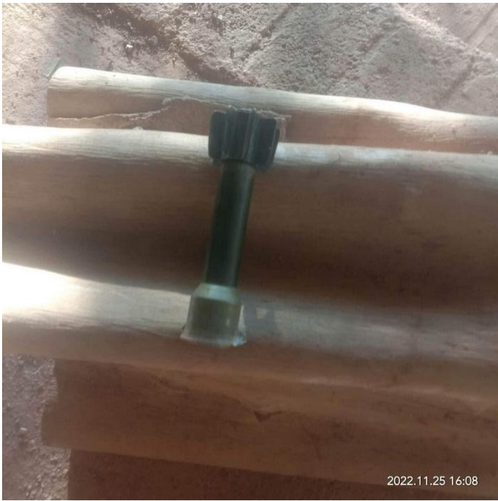
မပေါက်ကွဲသေးသော စစ်ကောင်စီ လက်နက်ကြီးများ

တိုက်ပွဲများနှင့်လက်နက်ကြီးပစ်ခတ်မှုများကြောင့် ကုန်းသာကျေးရွာနှင့် အနီးနားရွာများဖြစ်ကြသော နောင်အန်၊ ကုန်းပျဉ် ကျေးရွာများမှ ဒေသခံရွာသား ၇၀၀ ကျော်တို့သည် ၎င်းတို့၏နေအိမ်များမှ ထွက်ပြေး တိမ်းရှောင်ခဲ့ကြသည်။ အချို့မှာကျေးရွာရှိ ဘုန်းကြီးကျောင်းများ၊ ဘုရားကျောင်းများ နှင့် အချို့မှာ သီပေါ မြို့ပေါ်ရှိဘုန်းကြီးကျောင်းများသို့ထွက်ပြေးတိမ်းရှောင်ခဲ့ရသည်။