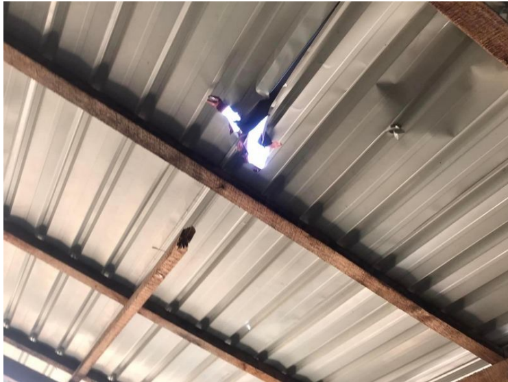
စစ်ကောင်စီတပ်ပစ်ခတ်မှုကြောင့် အိမ်ခေါင်မိုးများပျက်စီးခဲ့သည့်ပုံ