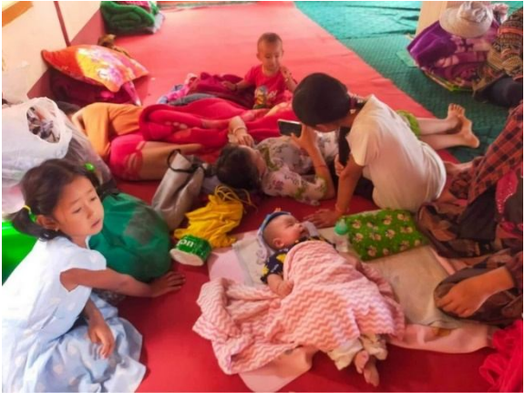
ဒေသခံများဘုရားကျောင်းများတွင်ခိုလှုံနေကြသည့်ပုံ

တိုက်ပွဲဖြစ်ပွားပြီးနောက် SSPP/SSA တပ်ဖွဲ့ဝင်များမှာ ကုန်းသာကျေးရွာမှဆုတ်ခွာသွားခဲ့သော်လည်း စစ်ကောင်စီတပ်သားများမှာမူ ကုန်းသာကျေးရွာစာသင်ကျောင်းအတွင်းတပ်စွဲနေထိုင်နေကြသည်။ နိုဝင်ဘာလ ၃၀ ရက်နေ့က နောက်ဆုံးရရှိသောအချက်အလက်များအရ စစ်ရှောင်ရွာသားအများစုမှာ နေအိမ်သို့ပြန် လာကြပြီး အချို့မှာ ၎င်းတို့၏နေအိမ်များကိုစစ်ကောင်စီတပ်သားများ၏ မွေနှောက်ရှာဖွေခြင်း ကိုခံခဲ့ရကြောင်းသိရသည်။