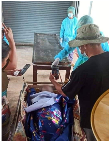
ခမ်းတူပ်တံး လံးပီး

သိုက်းမခမ်းလိတ်;ထမ်းခပ် လွင်းမခပ်,တိုက်,ခခမ်.သေ ပေယု.ထုပ်. တိုက်; ကီးယပ်;လုင်းလုင်းလိခမ်။ သိုက်းမခမ်း;ကပ်တိခမ်ပိတ်.ခပ် လံး လံး ဂမ်းလွမ်းရှပ် လွမ်းခေ့;ကူးလှိုင်းခမ်. တေ့,ထိုင်ခပ် သွင် ဂေ့.ပေယု လှိုမ်းတူပ်။ ဝံးခခမ်.သိုက်းမခမ်း;ခိုခမ်းကပ်ခပ်ခိုခမ်း; ဂူးသိုက်းခပ်သေ ကပ်လံးကွင်,ဂေ့,ကူး ဂျု,တီးရှိုင်းပလိက်/ငယးခပ် ငလ; ကပ်တူပ်လံးပီးဂျု, ရှိုင်းယု ဂျွန်းခမ်း။ သိုက်းမခမ်း; ဂေ့.ခိုင်;သမ်. ခိုခမ်းရှေ့ရူတ်းခိုင်း; ခပ်သွင်ဂေ့.ဂျု,တီးရှိုင်းငယးခပ်။