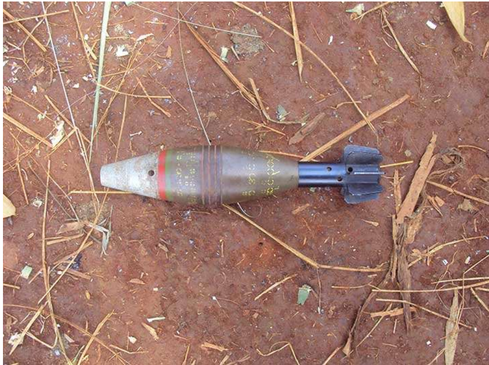
ပမ်မတ်ဟုရွာအတွင်း မပေါက်ကွဲဘဲ ကျရောက်သည့် 60 mm မော်တာကျည်