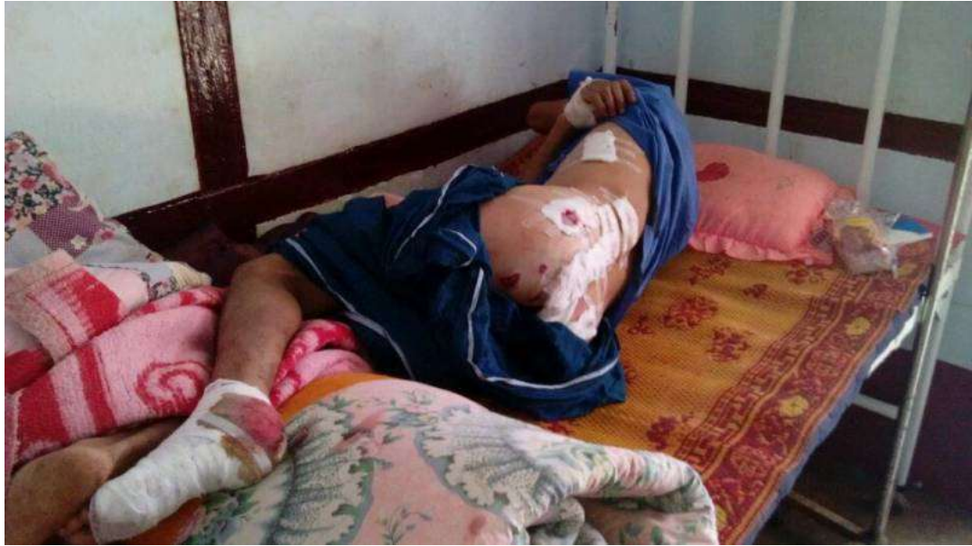
ပမ်မတ်ဟုရွာမှ ရွာသားတစ်ဦး အောက်တိုဘာလ ၄ ရက်နေ့တွင် မော်တာကျည်အပိုင်းအစ ထိမှန်ဒဏ်ရာရ