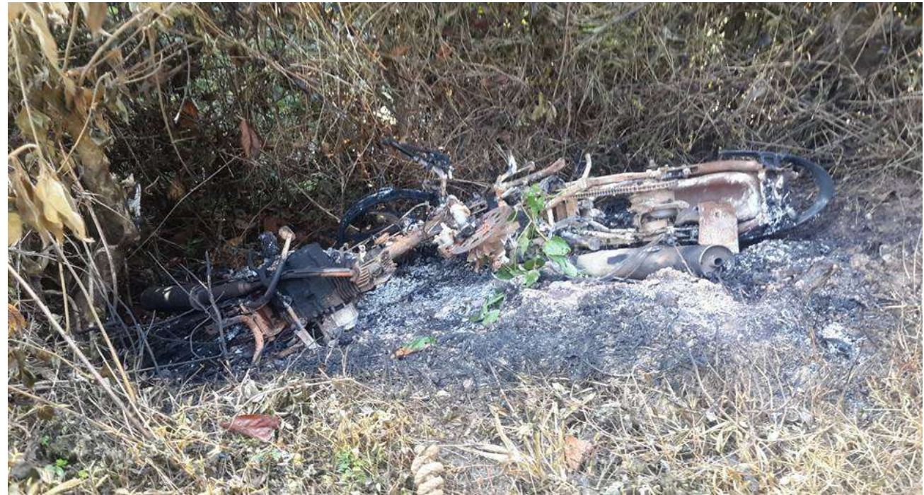
မိုင်းရယ် အသွားလမ်းမကြီးပေါ်တွင် မြန်မာစစ်တပ်မှ ရွာသားနှစ်ဦးအား ပစ်သတ်အပြီး မီးရှို့ဖြတ်ဆီး ထားသည့် သေဆုံးသူများ၏ ဆိုင်ကယ်နှစ်စီး

ယင်းရွာသားနှစ်ဦးမှာ ပုံအမ်းရွာမှ မိုင်းရယ်သို့ ဆိုင်ကယ်ဖြင့် ကျွဲဝယ်ရန်သွားရာ လွိုင်ဂျူကျို အနီး တပ်စွဲထားသည့် မြန်မာစစ်တပ်မှာ ၎င်းတို့နှစ်ဦးအား ပစ်သတ်ခဲ့သည်။ ယင်းသို့ပစ်သတ်ခဲ့ပြီးနောက် မြန်မာစစ်တပ် တပ်သားများမှ ၎င်းတို့ဆိုင်ကယ် နှစ်စီးအား မီးရှို့ဖြတ်ဆီးခဲ့ကြသည်။