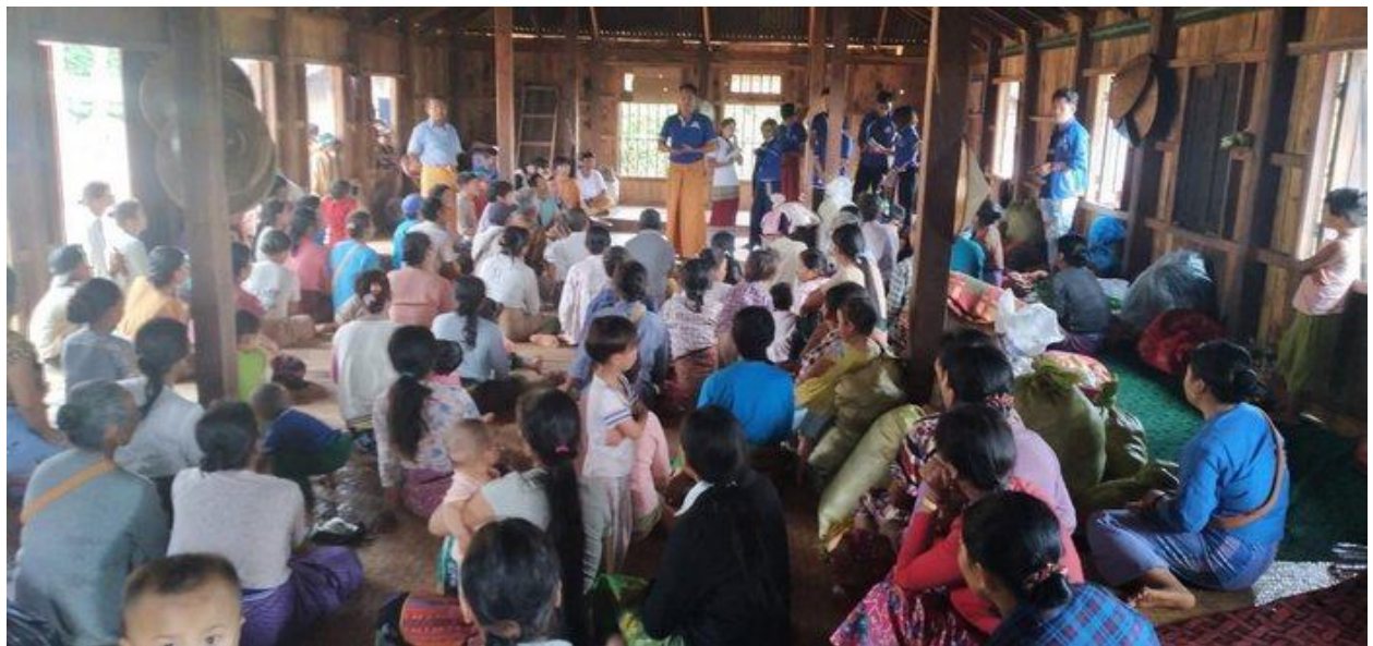
ဂူခင်းပံးဗေးမးပိုင်ဂျူမံးဝတ်ပာင်၊လေး

ဂူခင်းပံးဗေးခိုခင်းကွခင်းဂခင်းပွဂ်းရှိုခင်းခိုခင်းခင်းဝခင်းထိ 1/07/2020 ခခေယဝ့်။