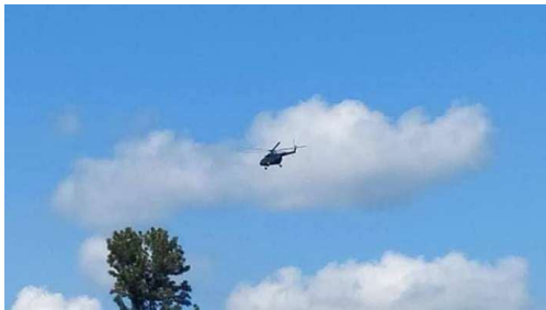
ရှိုခ်းမိခ်သိုက်မာခ်း ကခ်မးလိပ်;လွမ်းရှိုမ်း ဝါခ်းရှုတ်ခေးသေပွံ,မာ်,လုင်း

ဓားယမ်း 11 မှုးဂင်ခွံ ထိုင် 12 မှုးဂင်ဝါခ်းတိုင်; ရှိုက် မိခ် သိုက် မာခ်းလမ်းခိုင်; မိခ်မးတါး လးသိုက်; သေ မး လွမ်း ဝါခ်းရှုတ်ခေး။ ရှိုခ်းသိုက်မာခ်းမးပွံ,မာ်, ခွ်း ထိုခ်, ပးမိ. ယူ,တါးရှင်,ဝါခ်း; သေ ရှင်,ဂံဝါခ်းမွက်; 500 မိး တိုက်။ ဝံးခေခ်. ခိုခ်း ရှိုဂျ,ဂိပ်.ခိုင်;ယပ်. ဝံးခေခ်. မွက်; 10 ခေးထီးခိုခ်း လံ;ရှခ်မိခ်မးတီးကွင်;ဂပ်, ခေခ်. သေ ပွံ, မာ်,မွက်;သိပ်းလုက်;။