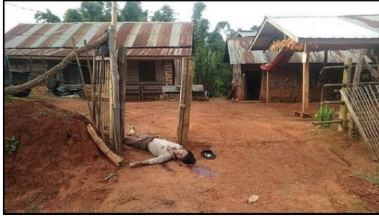
ခမ်းတူဝဲတံလင်းကေး

လင်းကေး ပွန်းခေးမးရှုလုဂ်မေးတီးရှိုခင်းသေ ဗွင်းမခင်း ကမ်,ရှခင်ဗွင်ခခေ. မခင်းဂျ,ထမ်လင်းတိုင်း ဂူခင်း ရှိုမ်းရှိုခင်းမခင်း လွင်းလုဂ်မေး မခင်း။ လင်းတိုင်း လတ်; မခင်းဝး လုဂ်မေးမခင်းဂျ, မီးတီးဂျင်းယပ်. ခံလေး လင်းကေး ဂေးလတ်;ဝး “လီယပ်.ပေးခခေ မိုဝ်ခခေ. ဂပ် ပီခခေဗုဂ်.ဝခင်း ဂပ်တေဂျ,ပွ.ဝခင်း သေဂွခခေ, ဝး ခခေ”။ ဗွင်းလင်းကေးတေကွဂ်,ဂျ,တီး ဗင်းတူ လင်းတိုင်း ခခေ. မဂ်,ကခခေသိုဂ်မခင်းယူ, တီးဂျင်း သေ