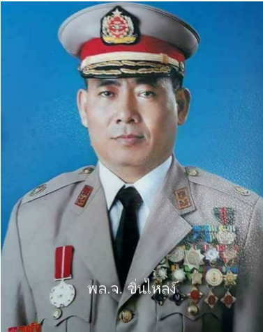
ဂိမ်လွမ်ရှၢခိ ခိခိ,လံး,

ဖှံမိုဝ်းတူခိခိ. ခခ,ငလးထီးရှုမ်းလူဝ်းတိုခိးသေ ပိခိဖှံကခိယွံ,လူဝ်ကခိခိဝ်းခိးသၢမ် ဖိခိခိဂၢခိဖှံ ခိုဝ်း မးခခခခ.ခွင်း ခိးလိဝ်း/တီး။ ဂိုင်းဖှံး တၢ, 90% ခိ.တေကပ်သုင်,လူးမိုဝ်းထီး။ မိုဝ်းလိုခိပူခိ.မးခခခခ.ဂေး ဂေးဂမ်ဂၢခိ ငဝ်းငုခိးလူဝ်ပွင်လိဝ်း; NLD ဂျးလေ,ယိမ်း; ဖှံသၢမ်ဖှံ ဖှံးဂျးလေ,မိုဝ်းခခ,ပိခိတၢင်းဂၢခိ။