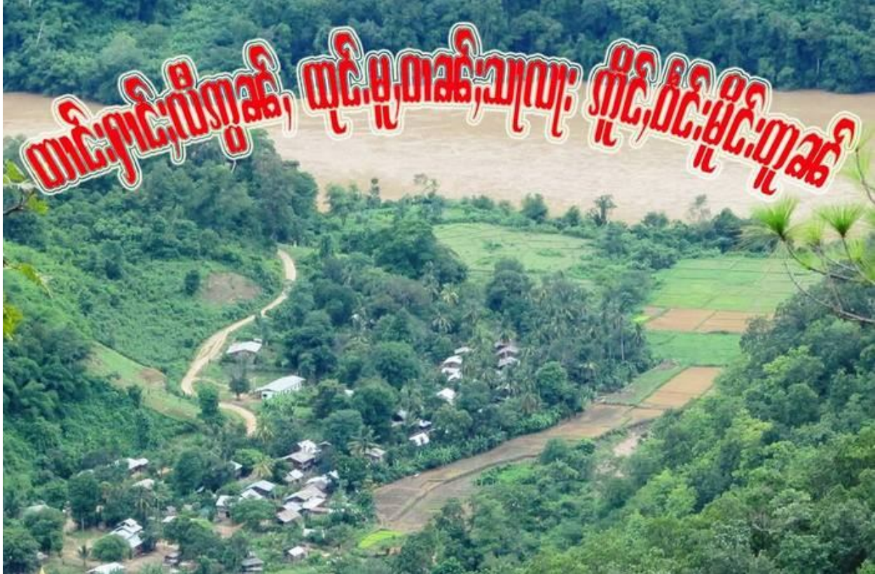
ထိုင်.ဝါခင်းသျလျး ပှို,ကွဂ်,ပှင်,ခမးခမ.ခင်း ငလးဝိုင်းမှိုင်းတူခင် ထိုင်မှိုင်းလီပ်ပံ,မီးပွဲ လုမ်းလု ပိုတ်,ရှပ်.ကပ်ပခင်းပွခင်းဝျးယိုင်းသေ ရှိတ်းနှိးဂူခင်းဝါခင်းကွခင်ဂခင်လွမ် ရှပ်ဝံ.ယူ,ယပ်.။ ဝါခင်းသျလျးခင်. မီးလင်ရှိုခင်း 50 ဂမ်းခခမ်ပီခင်တံး မခင်းမီးမွဂ်းသမ်လင်။

လံးပေ,တိခင်. ပီခင်ပျိ,တုလိတ်.မခင်း ပျးတုးပျိ,တုလိတ်. မှိုင်းဂင် ကခင်ပဂ်းတပ်.တီးခမးဂီခင်း ပွတ်း လာခင်းမှိုင်းတူခင်သေ တိခင်,ဝိခင်း ဂုမ်းဂမ်ကွခင်ရှပ်ဝံ.။ လံးပေ,တိ ဂူပ်.ဂူးတင်း ခောင်းခိုင်းသေ မီးလုဂ်း ယိုင်းဂေး. ခိုင်း;လိုင်;ရှင်.ခောင်းခမ်းခိခင်,။ လံးပေ,တိခင်. ရှိတ်းဂါခင်တတ်းမံ. ဂူလုးကမ်,လုးသီခင်းယို, မှိုခင်ခွမ်းပခင်း၊ လု.လိုင်;မံ.မှိုင်းသေမီးလုဂ်းခွင်.လွမ်းပွင်;။ ပွင်;မခင်းလျး ယိုင်းတံးခခင်. မခင်းခုင်; သိုင်းပျိ,တုလိတ်.။ မှိုင်းကွခင်တင်းပေးတေဂျ,ခင်းထိုခင်, ကွင်;တီးတတ်းမံ. မခင်းကမ်,ခုင်;သိုင်း; ခုင်း ပျိ,တုလိတ်. ဂူလုးဂျးတံးလုမ်းဂေး,သင်; ခခ,ခပ်ခပ်;မျးခင်းပိုခင်.တီးခင်. တျ,ဂူတ်,ထတ်း ဂါခင်သင်;ပေံ မှိုင်းတူခင်ခင်း လိုခင်ပွဲပပရူးဝျးရီး 2018 ခင်.မျးမခင်းဂေးသို,ခုင်းပျိ,တုလိတ်.မခင်း။ ဂူခင်းဝါခင်းခပ် လာတ်;ခခေဝျး တံးလုမ်းခခ,ခပ်ခပ်;မျးခင်. ပေံ,ရှုမ်,လုမ်းခင်ခင်းခေးမျးလိုင်ဂပ်, သေ မခင်းဂေးထင်,ဝျး မခင်းလုလွင်;ရှုမ်,လုမ်းလံးယပ်. ခုင်းခုင်းပျိ,တုလိတ်.လံးယပ်. ခင်ယပ်.။