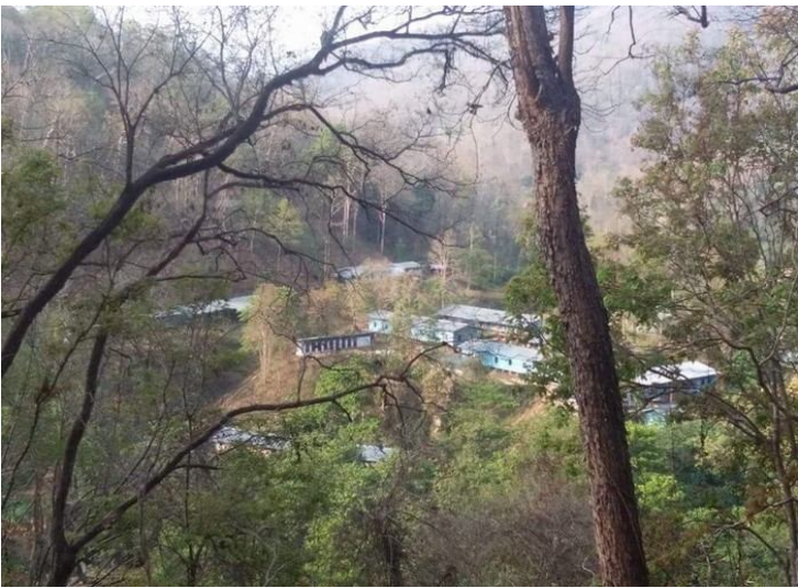
ဟင်္သာခေမးပု. တီးကခင်ဟူးဂေ့သင်းခေ၊ ခပ်လိဝ်းသင်း

ဂူခင်းတခင်းသုလုးလတ်းတုး ကမ်၊ လိး ရှပ်. ခေမ်.တွခင်းဟေခင်း လိမခင်းလွမ်း ခပ်သင်။ ခပ်ကမ်၊ လင်းဂူခင်း တခင်းရှိုတ်း ဂါခင် ခေလးဂူးဂူခင်းတခင်းဂေ့ ခပ် ကမ်၊ လင်း။ တေ့ခေခေ.ခပ်းခေမ်.တင်း ဂါခင် ဟင်္သာ ယိုဝ်း ခေခင်းခိပ်ဂေ့ ယင်းသိုပ်.ကပ် တီး တုးခီးလိက်မား။ ခပ်တိုခင်းကမ်၊ သိုပ်. တီးတခင်းသုလုး။ ဂူခင်းတခင်း ဂေ့.ခိုင် လတ်းတုး “ကခင်ရှမ်းလိးခေ.မီး ဟေခေ၊ မုက်.ဂူလုင်း”။ (ဂွမ်းတုးပေးဂူးခပ် ခပ်း ဟင်္သာ၊ တခင်းဟေခေ၊ မုက်.ပေးဂုမ်းလုင်ဂျ၊ သိုင်) ခေယပ်။